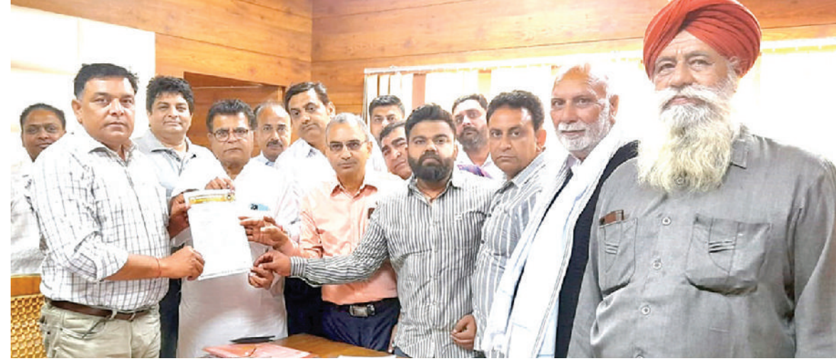
सिरसा। एसडीएम को ज्ञापन सौंपते हुए आदती एसोसिएशन।