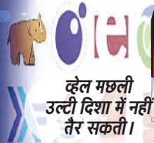
व्हेल मछली उल्टी दिशा में नहीं तेर सकती।