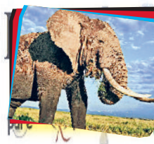
हाथी अपनी सूड़ में पांच लीटर पानी रख सकता है।