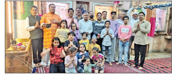
फतेहाबाद। प्राचीन बाबा रामदेव मंदिर रामदेवरा में फाल्गुन माह के उपलक्ष्य में पूजा अर्चना करते श्रद्धालु।